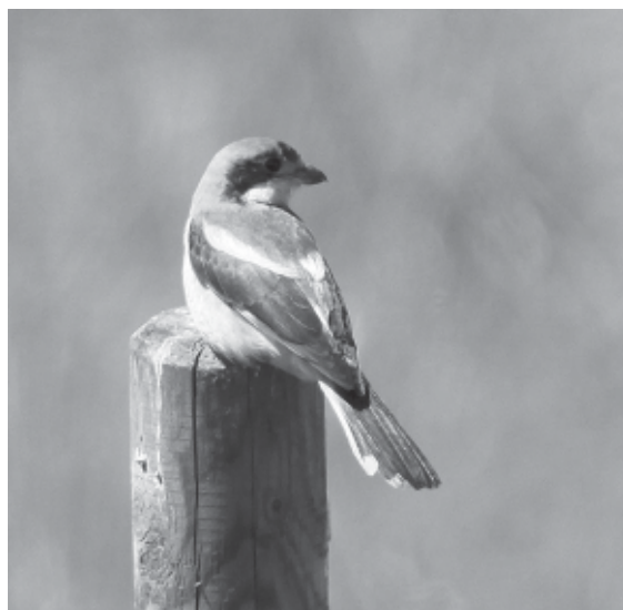
Rödhuvad törnskata.

Under året har en mängd fågelarter och individer synts i vårt verksamhetsom-råde, värt att nämna kan vara någon av de mer udda gästerna som glädde oss med sina besök.